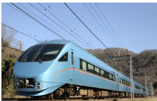
特急ロマンスカー・MSE（60000形）

「ARUCLUB MACHIDA」は、歩いて試合会場に向かうお客さまを増やすことで健康増進はもちろん、ユーザー同士の交流やまちの魅力を再発見する機会を創出するほか、町田市が抱える課題の1つである鶴川駅前の交通渋滞の緩和、CO 2 排出量削減といった社会課題の解決へ向けたアプローチから地域活性化を図ることを目的に開発したスマートフォンアプリです。