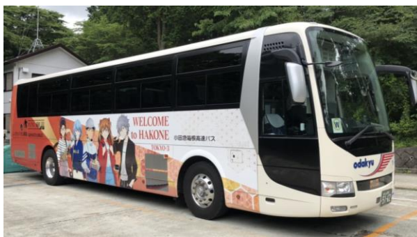
高速バスのラッピング

箱根寄木細工をイメージした背景にキービジュアルとエヴァンゲリオンの機体が大きくデザインされたラッピングバスと、ネルフ本部をイメージしたデザインのラッピングバス（高速バス1台、箱根線山内シャトルバス1台限定）の運行を当面の間、継続します。