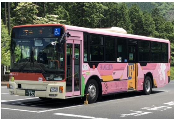
エヴァンゲリオンバス前方（8号機）

エヴァンゲリオン「零号機」、「初号機」、「2号機」、「Mark.06」、「8号機」の機体カラーをイメージしたエヴァンゲリオンバス（5台限定）の運行を当面の間、継続します。