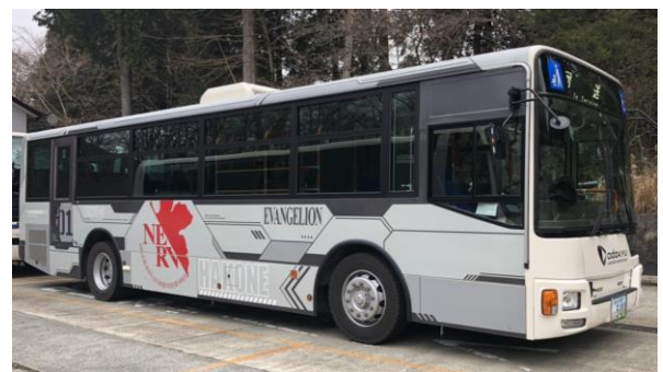
箱根線山内シャトルバスのラッピング