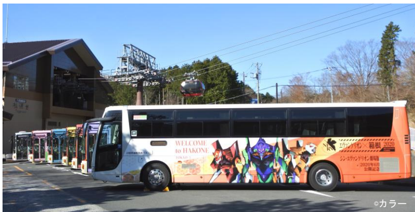
オリジナルラッピングバス

「エヴァンゲリオン×箱根 2020 MEET EVANGELION IN HAKONE」第7報！の詳細は下記のとおりです。