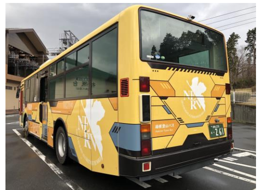
エヴァンゲリオンバス後方（零号機）