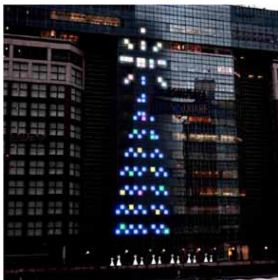
タカシマヤ タイムズスクエア 『SUN LAMPイルミネーション』