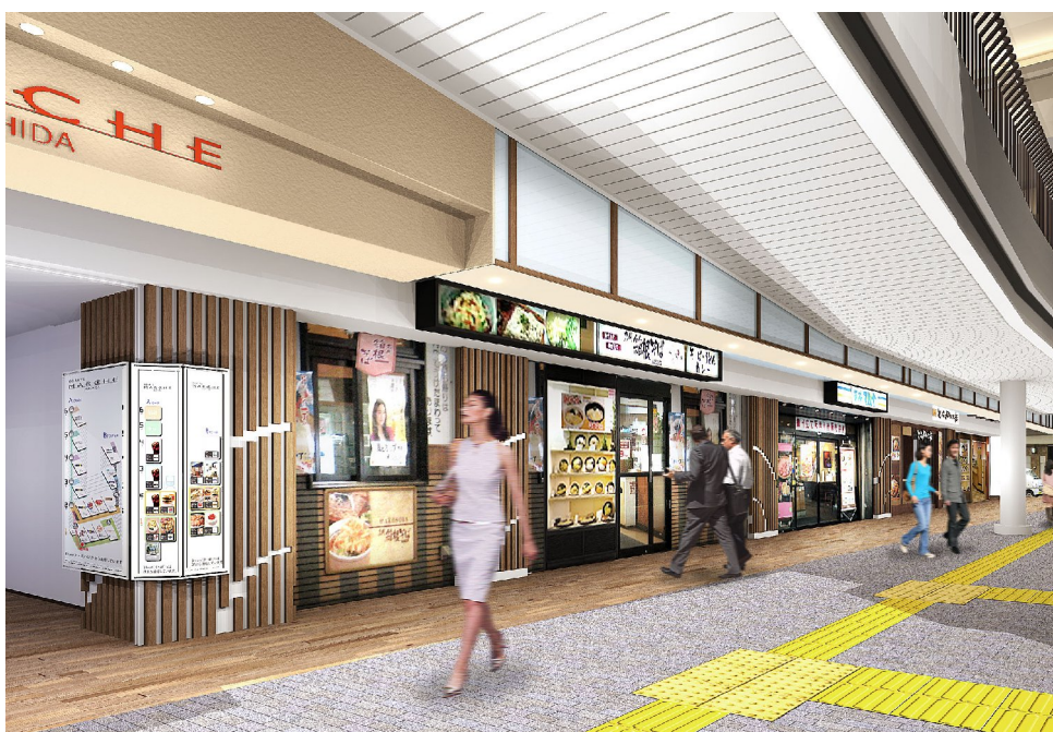
小田急マルシェ町田(イメージ)