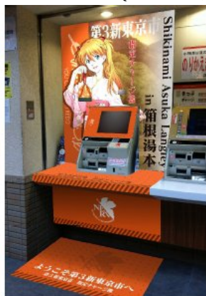
箱根湯本駅のPASMOチャージ機 外観イメージ