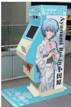
小田原駅のPASMOチャージ機 外観イメージ

綾波レイ、式波・アスカ・ラングレー、碓シンジ、渚カヲル、赤木リツコ、ペンペン 画面に登場するキャラクター（ぶちえう`あバージョン）は両駅共通です。