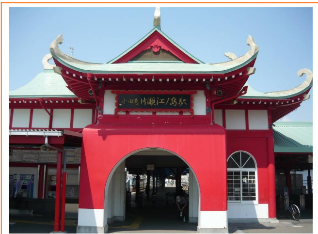
日中の片瀬江ノ島駅