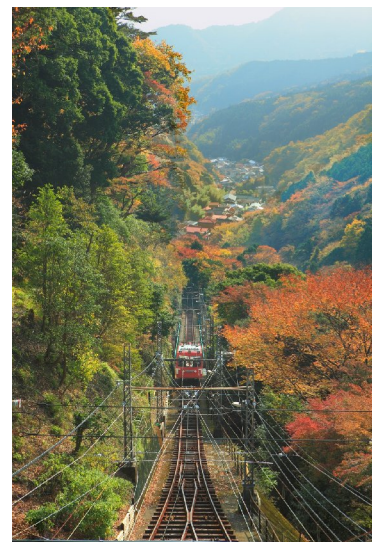
秋の紅葉が美しい「大山」地区の様子