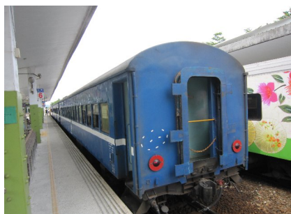
旧型客車の普快車3671次