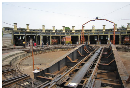
彰化機務段扇形車庫