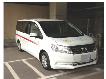
2013年3月開設の「小田急こどもみらいクラブ supported by ピグマキッズ梅ヶ丘」 （左：同施設外観、中央：同施設内観、右：お迎えに使用する車両）