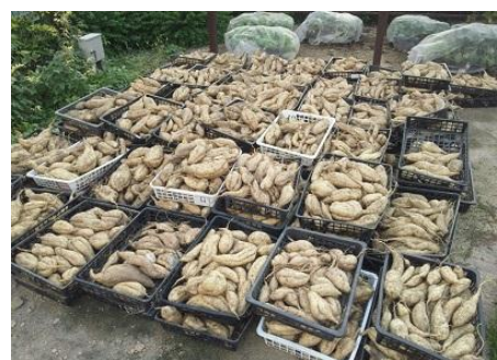
収穫された「黄金千貫」