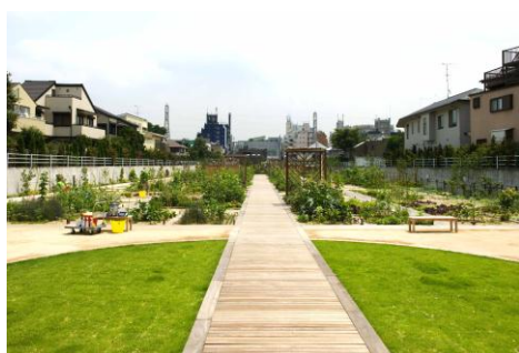
5,000㎡の広さがある菜園