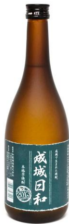
成城日和 (イメージ)

また、今年から新たに「焼酎オーナー」制度を設けました。2015年の春に完成する『成城日和』の製造に、さつま芋づくりから参加していただけるオーナーの方を募集いたします。