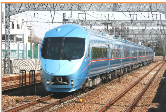
「ロマンスカー・MSE」（60000形）