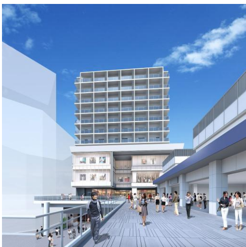
「ビナフロント」外観（イメージ）

海老名駅東口には、当社施設の大型ショッピングセンター「ビナウォーク」や駅ナカ商業施設「小田急マルシェ海老名」があります。これらに加え新たなランドマークとして「ビナフロント」が誕生することにより、駅から徒歩圏内に生活に必要な衣食住の環境が整い、映画館などのレジャー施設もあわせ持つ、新しい街として生まれ変わります。