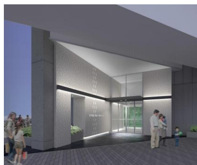
「リージア海老名ビナフロント」 エントランス（イメージ）