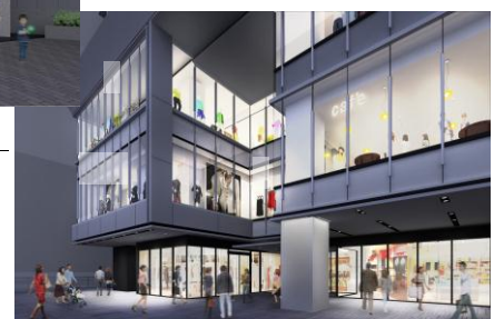
「ビナフロント」エントランス （イメージ）