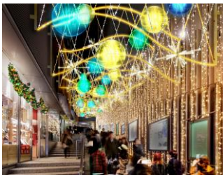
新宿ミロード モザイク通り