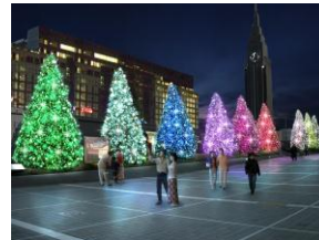
新宿サザンテラス入口