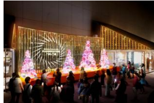
新宿ミロード モザイクステージ