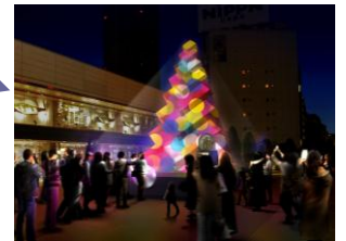
新宿サザンテラス広場★