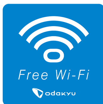
「odakyu Free Wi-Fi」ロゴ

ご利用可能なサービスは、「au Wi-Fi SPOT」(KDDI)、「Wi2 300」(ワイヤ・アンド・ワイヤレス)です。