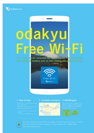
掲載ポスター(イメージ)