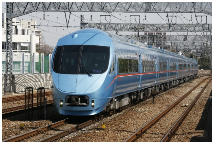
「メトロおさんぼ号」に使用するロマンスカー・MSE（60000形）