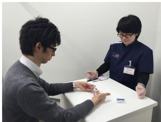
検査の様子(イメージ)

昨年4月、厚生労働省により制定された検体測定室ガイドラインに基づく「利用者自身による採血・消毒」等を条件とした、医療行為に該当しない施設です。