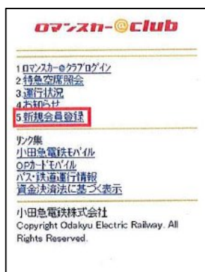
「ロマンスカー@クラブ」新規会員登録画面 (携帯電話画面のイメージ)

「e-Romancecar」は、会員登録不要で、インターネットによる特急券予約・購入などがご利用いただけるサービスです。お客さま情報として電話番号・メールアドレス・クレジットカード情報などを入力いただき、特急料金のお支払いは、クレジットカードでの決済となります。