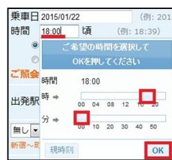
スライド式、タップ式画面