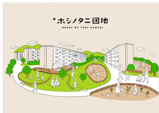
「ホシノタニ団地」イメージ