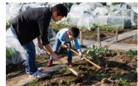
貸し農園(イメージ)

農園には貸し道具を取り揃えてあり、育てる野菜の種や苗・肥料等をすべてご提供いたします。農園スタッフによる野菜の育て方の指導も行っているため、初めての方でも安心して野菜を育てることができます。野菜の栽培を通じた交流の場として「畑で愉しむ週末」をお楽しみください。