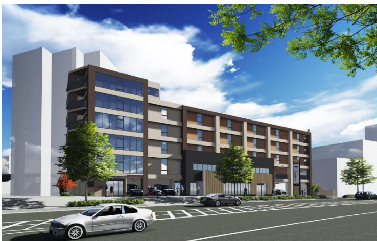
「レオーダ新百合ヶ丘」外観（イメージ）