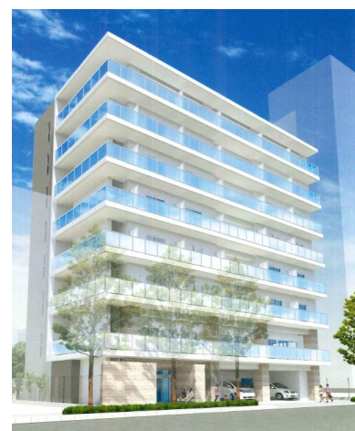
「レオーダ藤沢」外観（イメージ）