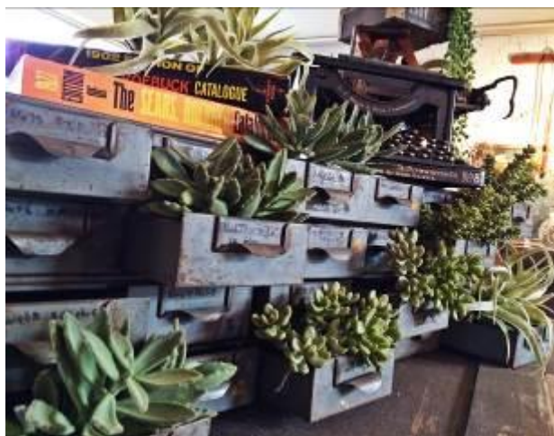
「いなざうるす屋」商品イメージ

2015年8月10日（月）から2015年9月9日（水）までは、WEBショップで大人気のフェイクグリーンショップ「いなざうるす屋（INAZAURUS. YA）」が出店し、フェイクグリーンと雑貨を組み合わせた空間創りをご紹介しますとともに、フェイクフラワーなどを販売します。