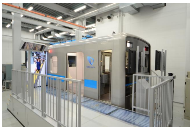
車掌用のシミュレータ

鉄道係員の養成や社員の研修などを行う小田急研修センターで、車掌用のシミュレータなどの体験や、複雑な線化事業を進めている工事区間を見学します。実際に工事区間などを見学することで、理工系分野の技術が、鉄道を通じて私たちの生活を快適で便利なものにするために役立っていることを感じていただきます。