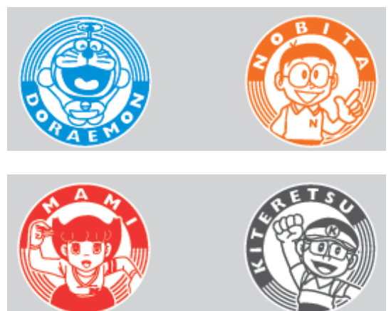
クーポンブック（表紙）