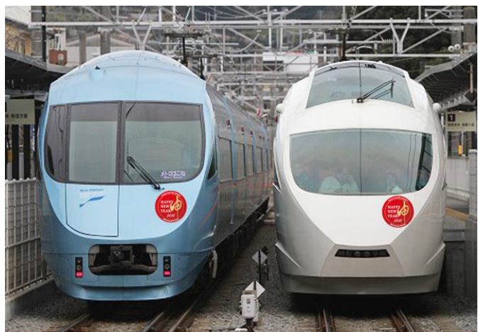
2016年の干支（ さる 申） のヘッドマーク（イメージ）