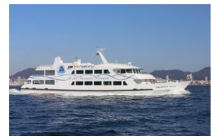
クルーズ船(イメージ)