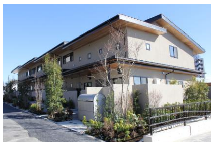
賃貸住宅『リージア代田テラス』