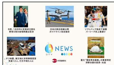
ニュース画面 （イメージ）