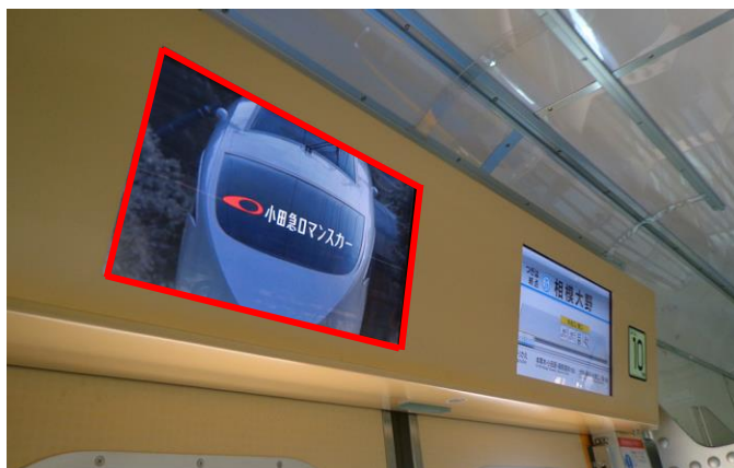
液晶ディスプレイ（左側赤枠・イメージ）

天気予報・ニュースの配信により、ご乗車のお客さまにより快適で便利な環境をご提供いたします。