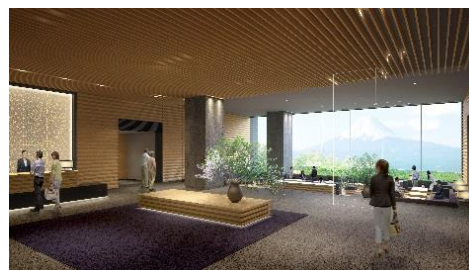
ホテルロビー (イメージ)