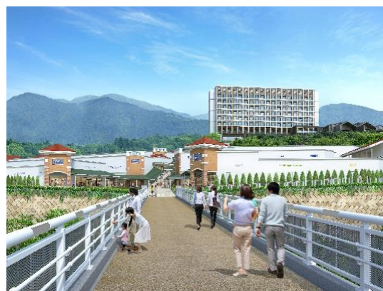
（仮称）小田急御殿場ホテル（イメージ）