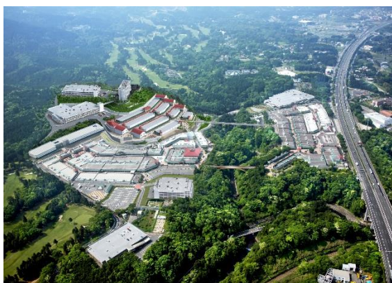
御殿場プレミアム・アウトレット（イメージ）

三菱地所・サイモン及び小田急電鉄では、第4期増設とホテル・日帰り温泉施設開業を機に、新たなアウトレットの楽しみ方を提案し、御殿場エリアを世界に誇れるショッピングリゾートへと進化させます。さらに、交通アクセスの拡充を図ることで、近郊の箱根等とともに、御殿場プレミアム・アウトレットをハブ施設とする一大広域観光リゾートエリアを目指します。