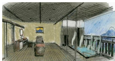
貸切個室露天風呂 (イメージ)