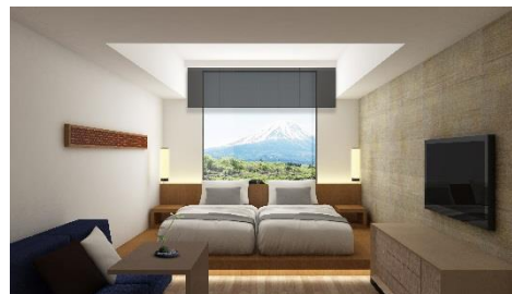
ホテル客室 (イメージ)