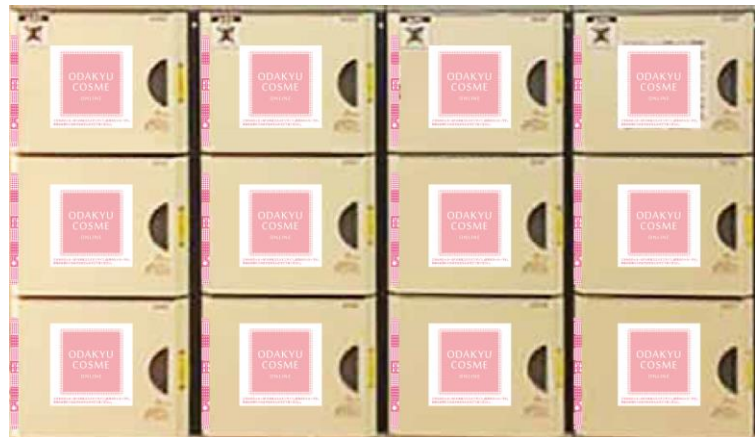
商品受け取り専用ロッカー（イメージ）

「駅のコインロッカーを活用した商品受け取りサービス」の概要は、以下のとおりです。