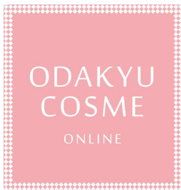
小田急コスメオンライン

今後は、小田急線全駅でのコインロッカーのICカード対応化を進め、小田急沿線への展開を検討します。また、小田急グループ流通各社において、EC市場の拡大に伴う不在時の再配達増加へ対応するなど、「長期ビジョン2020」に基づき、多様化するお客さまのニーズにあわせた駅構内機能の強化を図ってまいります。