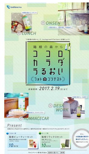
キャンペーンポスター（イメージ）