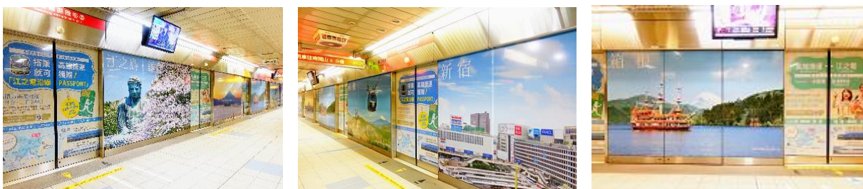
高雄メトロ 高雄国際空港駅 ホームドア広告