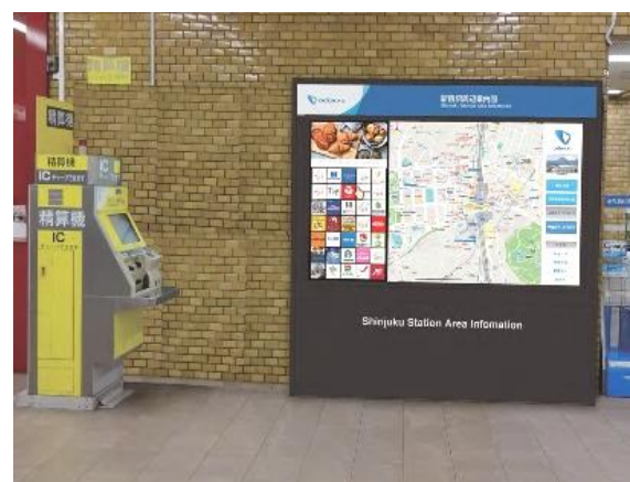
「多言語駅周辺案内図」の設置イメージ