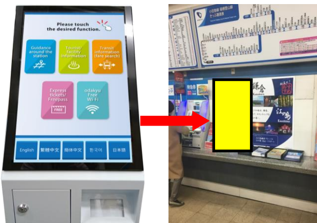
「多言語案内機」の設置イメージ