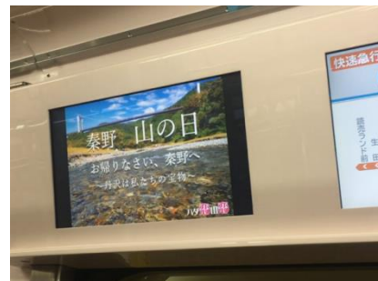
駅や車両を活用し、秦野市の魅力を沿線全体にPR (イメージ)