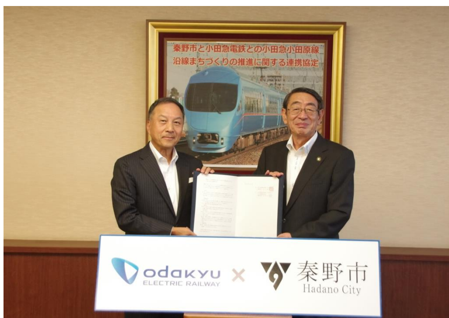
星野社長（左）と古谷市長（右）

これらを踏まえ、今後、両者が連携・協力し、駅の機能向上および駅を中心としたまちづくりを推進するとともに、地域の活性化および地域の魅力発信を行い、相互の付加価値を高めてまいります。