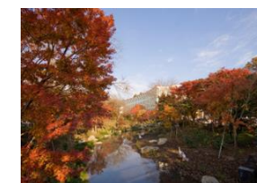
▲御殿場高原時之栖

レストランや温泉、宿泊施設を持つリゾート施設です。ここで味わえる地ビールは富士山の湧き水とドイツの技術が生んだ逸品です。