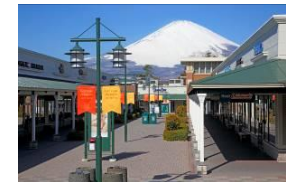
▲御殿場プレミアム・アウトレット

国内最大級のショップ数を誇る「御殿場プレミアム・アウトレット」は、まるで「森の中の街」。ファッション、スポーツ、インテリア、雑貨などジャンルも豊富で、レストランも充実しています。