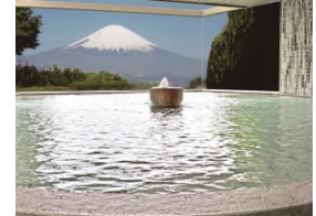
▲ごてんば市温泉会館