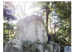
▲「御殿場発祥の地」碑

※みくりや・・・中世、御殿場地方は伊勢神宮に食糧を納める荘園の1つであったことから「大沼鮎沢御厨」と呼ばれ、現在でも御厨と呼ばれています。