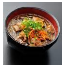
▲御殿場みくりやそば

この地方では、昔から山芋をつなぎに使ったそばを、各家庭で打って振る舞っていました。汁の具に鶏肉、人参、しいたけを使うのがポピュラーな御殿場のソウルフード。大晦日や、人が集まる時に振る舞われる、ふるさとの味です。