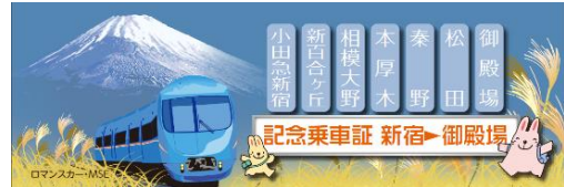
▲記念乗車証イメージ(裏)