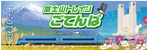
▲記念乗車証イメージ(表)