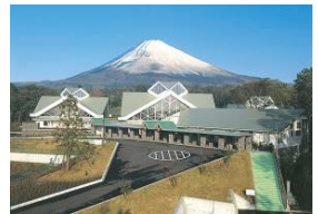
▲御胎内温泉健康センター

富士山を眺めながら入浴ができ、大きな富士山と深い木立、清涼な空気の中で時間もゆっくり過ぎていきます。都会では味わえない広々気分です。