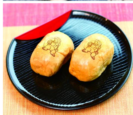
ゴジラオリジナルメニュー（イメージ）