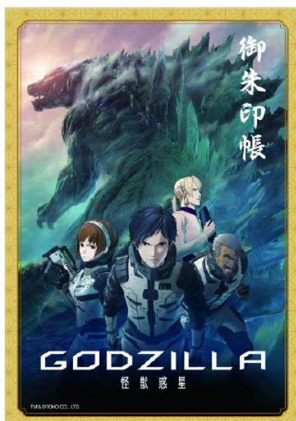
「ゴジラオリジナル御朱印帳」（イメージ）