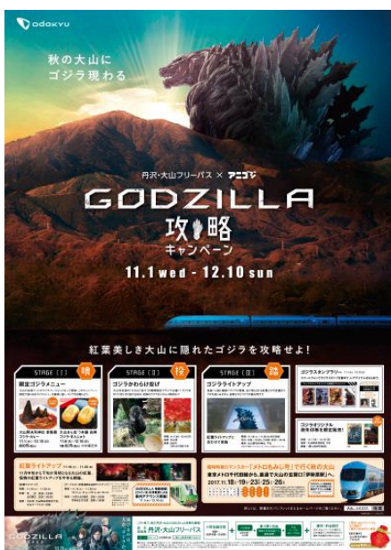
キャンペーンポスター（イメージ）