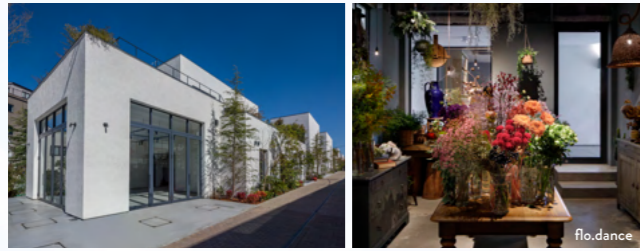
MAP 01 reload 路地のような空間に洗練された個店が集まる

小田急線「東北沢駅」～「世田谷代田駅」の線路跡地を開発して生まれた、全長1.7kmの新しい“街”。 たくさんの木々や草花にあふれ、歩いているだけで心地のいい時間を過ごすことができます。 ロケ地巡りの際には、是非お立ち寄りください。袖や想たちにも、いつかどこかで出会うかも？