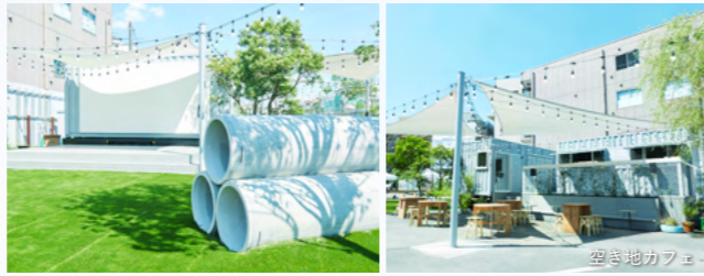
MAP 02 下北線路街 空き地 みんなでつくる自由なあそび場

都会の喧騒を忘れさせてくれる情緒あふれる温泉旅館。大浴場では箱根から運ぶ源泉を楽しめる。割烹や茶寮、SOJYU Spaは宿泊客以外も利用可能（一部事前予約制）。