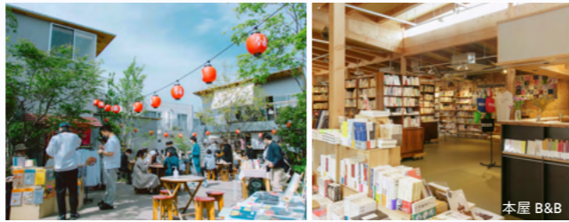
MAP 04 BONUS TRACK バラエティー豊かな食やイベントのエリア

常設のカフェスタンドや、シモキタらしい個性的なイベントの数々、さらに定期的にオーナーが入れ替わるPOP UP キッチンも。