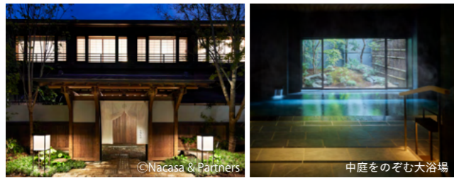
MAP 05 由縁別邸 代田 都心から最も近い温泉旅館

下北沢駅直結、“まちのラウンジ”をテーマにした5階建ての複合施設「(tefu) lounge」と路面飲食店、野原の広場、アートギャラリーなどがあるエリア。2階のデッキにはベンチも。