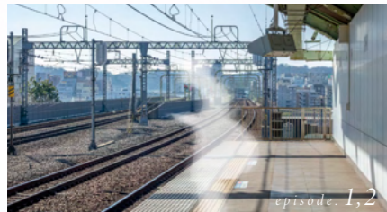
和泉多摩川駅2番ホーム (小田原方)

第1話で漢斗がスマホで想にメッセージを送ろうとした場所。同駅ロータリーは、第2話で漢斗が袖に電話で「パンダ落ちる」の動画を見るよう伝えたシーンでも登場します。