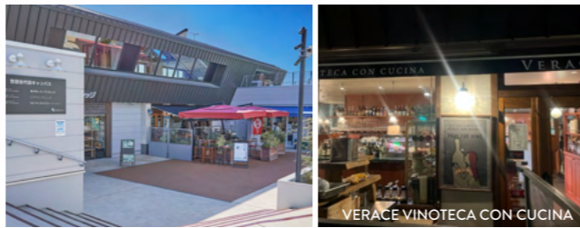
MAP 06 世田谷代田キャンパス (愛称: マンマダイタ) 食でつながる地域のコミュニティハブ

下北沢駅から世田谷代田駅に続く遊歩道にある、ここにしかないような飲食店や物販店13店舗が集まるエリア。広場のテーブルではのんびり食事やお茶を楽しめます。