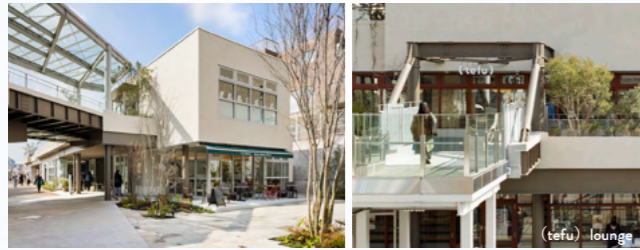
MAP 03 NANSEI PLUS (ナンセイプラス) 下北沢駅南西口改札前の一番新しいエリア

下北沢駅と東北沢駅の間にある、低層分棟形式の“個店街”。ユニークなセレクトショップや感性を刺激するフラワーショップ、カフェやレストランなどのお店が並びます。