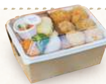
恋する豚のコロケ弁当 ¥880(すべて税込)