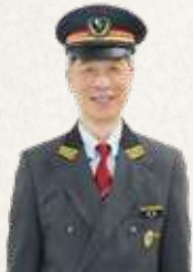
小田急電鉄株式会社 成城学園前管区 管区長兼成城学園前駅長