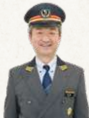
小田急電鉄株式会社 成城学園前管区 下北沢駅長

「下北線路街」は、小田急線「東北沢駅」～「世田谷代田駅」の地下化に伴い、全長約1.7kmの線路跡地を開発して生まれる新しい“街”です。