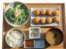
恋する豚のコロケ定食 ¥1,078