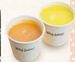
スムージー各種 ¥850~(税込)