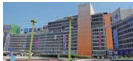
小田急百貨店、Odakyu OX お買物割引券