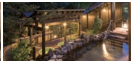
箱根湯寮ほか 箱根エリア施設各種割引券

※掲載している株主優待制度は一例です。株主優待制度の詳細に関しては、当社ホームページ「株主の皆さまへ」をご覧ください。 ※一部割引除外となる場合がございます。また、優待の内容については変更する場合がございます。