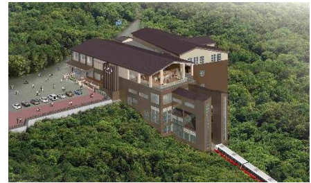
早雲山駅外観イメージ

箱根登山鉄道(株)、箱根ロープウェイ(株)では早雲山の新駅をリニューアルオープンいたします。駅舎は地上2階、地下1階の構造で各階にエレベーターを設置し、スムーズな乗り換え動線を確保するとともに、多目的トイレを整備するなどバリアフリー設備も充実します。また、木目を基調とした温かみのある空間を創出するとともに、安心してご利用いただけるよう授乳室や救護室を設置します。地上2階には、新スポット「c u - m o 箱根 (クーモハコネ)」が同日にオープンします。箱根外輪山、強羅の街なみ、相模湾を一望できる展望デッキを設けるとともに、無料の足湯施設も併設し、ダイナミックな眺望を新たにお楽しみいただけます。箱根ロープウェイ(株)直営のショップでは、旅の途中に楽しめるスイーツや可愛らしさやレトロ感を出したグッズなどを取り揃えます。