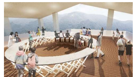
c u - m o 箱根内観イメージ