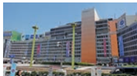
小田急百貨店、Odakyu OX お買物割引券