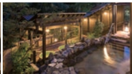
箱根湯寮ほか 箱根エリア施設各種割引券

※掲載している株主優待制度は一例です。株主優待制度の詳細に関しては、当社ホームページ「株主の皆さまへ」をご覧ください。 ※一部割引除外となる場合がございます。また、優待の内容については変更する場合がございます。