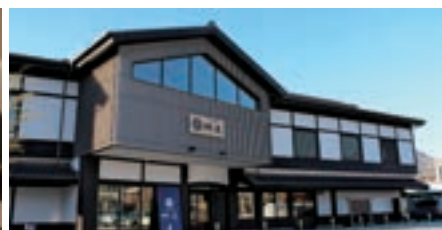
茶屋本陣「畔屋」ほか 箱根エリア施設各種割引券

*掲載している株主優待制度は一例です。株主優待制度の詳細に関しては、当社ホームページ「株主の皆さまへ」をご覧ください。