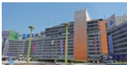
小田急百貨店、Odakyu OX お買物割引券