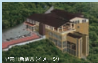
早雲山新駅舎(イメージ)

や世界各地から訪れるお客さまに一層楽しく、快適に箱根を周遊していただき、「特別な想い出」として心に残る経験のお手伝いをすることで、今後も箱根エリアの発展に貢献してまいります。