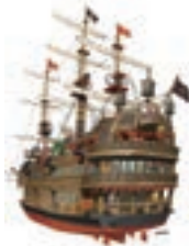
新型海賊船(イメージ)