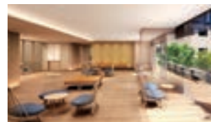
湯上がりラウンジ、中庭(イメージ)