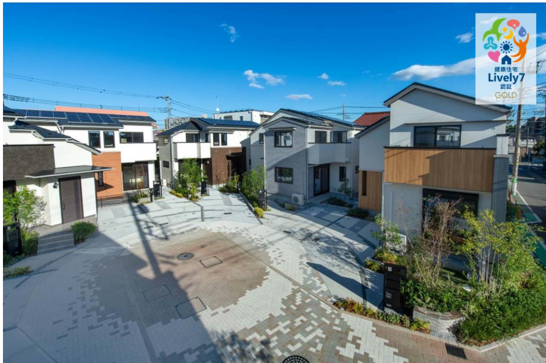
リーフィア 蒼翠の街 外観（昼景）

これらの工夫は本認証が定める、心身の望ましい状態に影響を及ぼす7つの領域のうち、特に「運動」「生体恒常性・代謝」領域で高く評価されたことに加え、「心の健康」に貢献する項目でも評価を得られました。