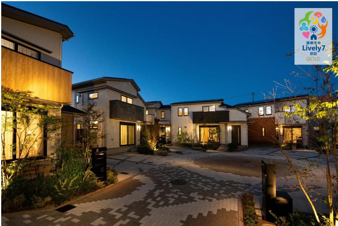
リーフィア狛江 蒼翠の街 街区中央のクルドサック(夜景)