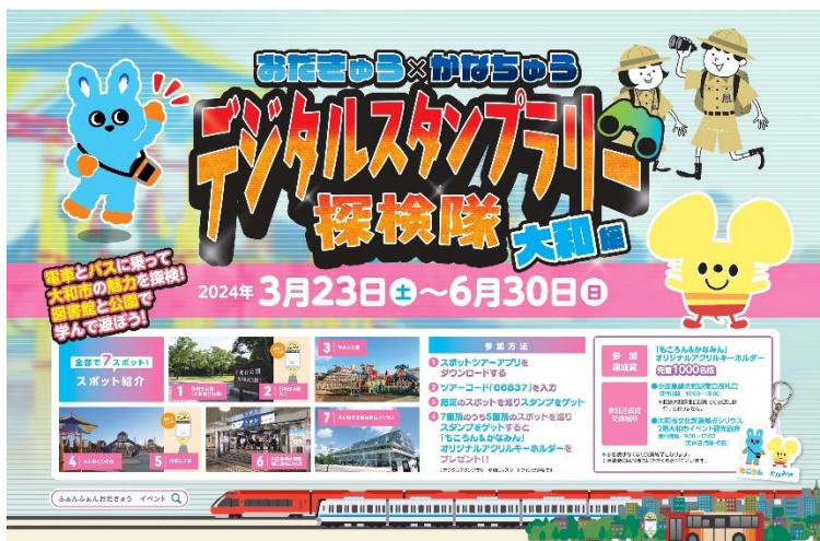
イベントポスター

ご参加には、スマートフォンやタブレット端末にアプリ「Spot Tour」をダウンロードいただければ、どなたにも無料で、さらに期間中であれば日をまたいでもご参加いただけます。5カ所以上でスタンプを集めていただき、所定の場所でご提示いただければ、参加達成賞をプレゼントします。