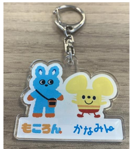
参加達成賞（アクリルキーホルダー）

当社では、「子育て応援ポリシー」を掲げ、小児IC運賃の低廉化や子育て応援車の運行、沿線パートナーと連携したイベント開催などに取り組んでいます。今回は、スタンプラリーという企画の中で、小田急沿線で展開されている公共施設や、電車・バスでの楽しい移動時間の再発見機会にしたいと思いきから実施します。なお、「もころん」は当社の子育て応援マスコット、「かなみん」はお客様や地域のみなさまにより親しんでいただくためのマスコットであり、このコラボレーションデザインは、お子さまに健やかに成長いただき、両社に親しみを感じていただきたい思いを込めたものです。