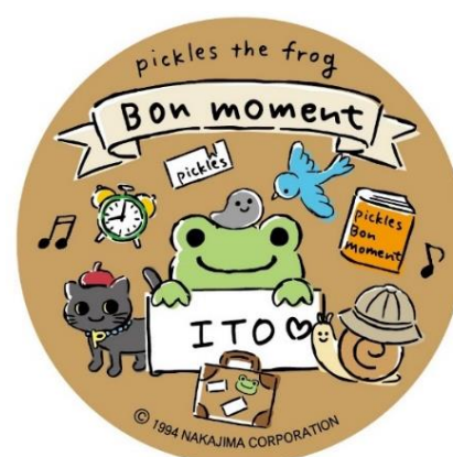
図3 かえるのピクルス Bon moment@伊東のキービジュアル

当社としましては「かえるのピクルス Bon moment@伊東」を通して「かえるのピクルス」のファンの方々をはじめ、伊東を知らなかった方にも足を運んでいただき、旅先での風景・体験などを楽しんでいただければと考えております。