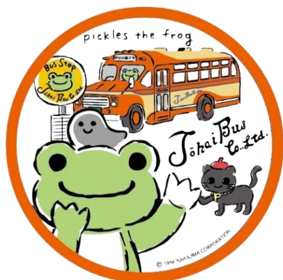
図2 東海バスコラボのキービジュアル

その他にも、「かえるのピクルス Bon moment@伊東」では、観光施設を巡るスタンプラリーや、ピクルスがデザインされたラッピングバスが伊東市内を路線バスとして周遊します。また、伊豆ぐらんぱる公園に隣接する伊豆グランヴィレッジでは「かえるのピクルス」とのコラボレーションルームが期間限定で登場します。同施設は本年7月にオープンし、バス・トイレ・エアコンを完備した新感覚のグランピングが楽しめる宿泊施設です。