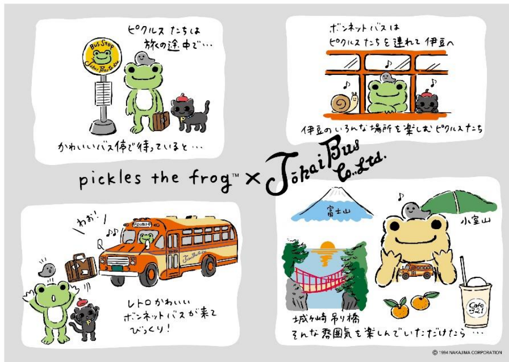
図1 かえるのピクルス Bon moment@伊東のストーリー

東海自動車株式会社（本社：静岡県伊東市 社長：金野 祥治）と株式会社ナカジマコーポレーション（本社：東京都江東区 社長：中島 伸二）の人気キャラクター「かえるのピクルス」がコラボしたイベント「かえるのピクルス Bon moment（ボンモモン）@伊東」が11月19日（土）よりスタートします。