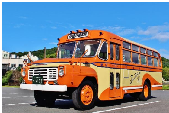
ボンネットバス「伊豆の踊子号」

1964年式のボンネットバスで、1976年6月から天城路の観光路線バスとして活躍し、ボンネットバスブームの火付け・牽引役となりました。2022年2月から7月にかけて、腐食部分や外装内装、ブレーキ回りのリニューアル整備を行い、現在も当社のシンボリック的存在として活躍しております。