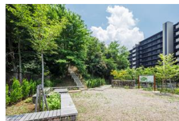
コミュニティテラス