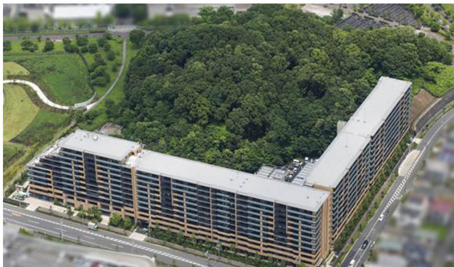
民有緑地「さとやまの森」を中央に配した敷地全景