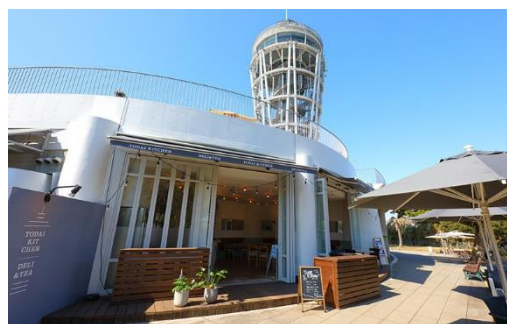
「TODAI KITCHEN DELI&TEA」