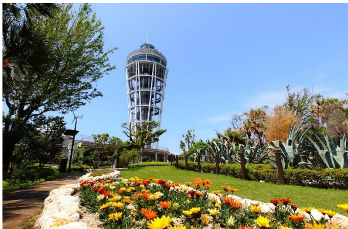
江の島シーキャンドル&amp;江の島サムエル・コッキング苑

「『ととのうまち。藤沢』デジタルスタンプラリー」は、9つのスタンプスポットを巡っていただく周遊企画です。藤沢市内でお勧めの寺社や公園などにあるシェアサイクルポートをスポットにしており、自転車で巡る中で地元のお店に出会うなど、街の新たな魅力を発見いただけます。全スタンプ獲得者には、湘南名物「松月堂わびすけ」のドーナツか、「Goodman Coffee」のオリジナルドリップバッグなどを景品としてご用意しています。