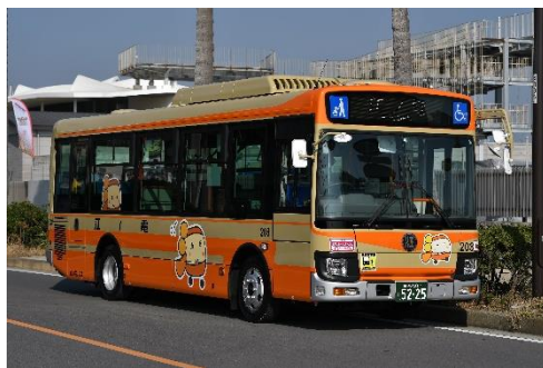
江の島を走る江ノ電バス