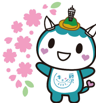
スタンプラリーのスタンプイメージ