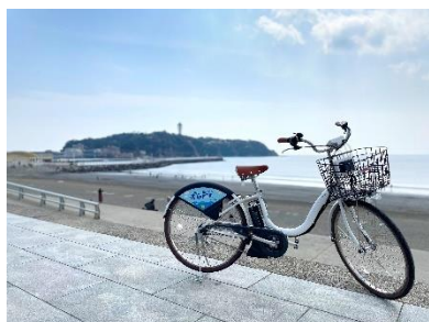
電動アシスト自転車