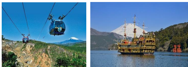
国際ブランドのタッチ決済を導入する 箱根ロープウェイ・箱根海賊船