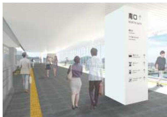
▲「南北自由通路」の内観イメージ