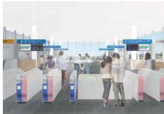
▲新しくなる「鶴川駅」改札口の内観イメージ