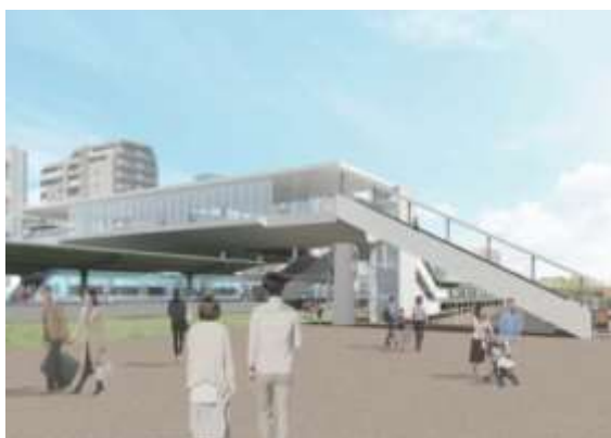
▲「南北自由通路」の外観イメージ