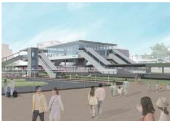
▲新しくなる「鶴川駅」の外観イメージ