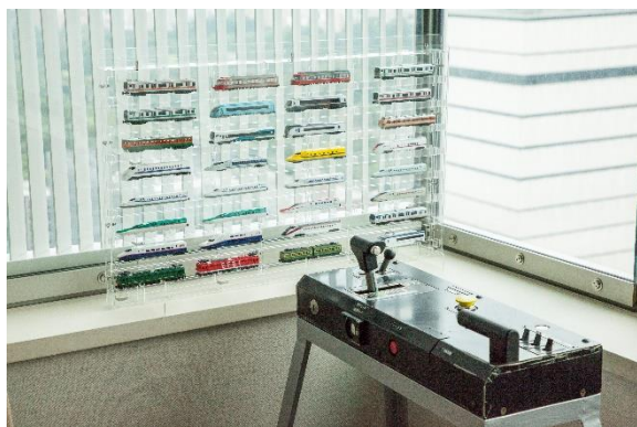
お部屋の中に株式会社トレイン製「Nゲージダイキャストスケールモデル」32台と実車のマスコンハンドルを設置

ホテル公式ウェブサイト https://www.southerntower.co.jp