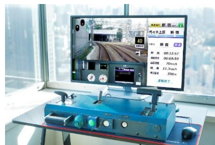
特急ロマンスカー・EXEの運転台機器を用いた小田急かんたんシミュレーター