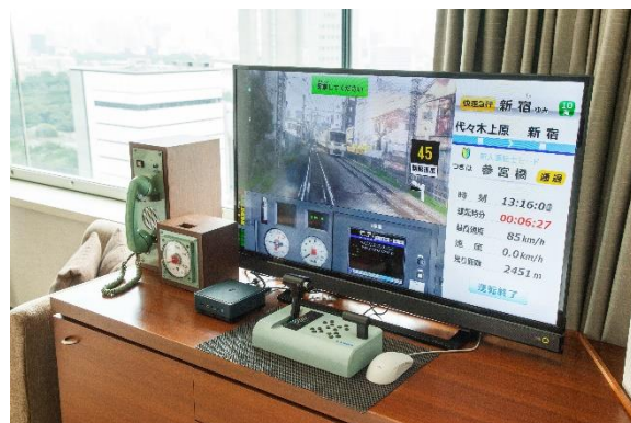
お子様でも簡単操作！で運転士気分 テレビに接続した小田急かんたんシミュレーターLiteと、株式会社瑞起製ゲーム機用ワンハンドルコントローラー