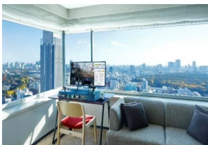
特急ロマンスカー・SEの座面を用いた椅子とパノラミックキングルームからご覧いただける風景