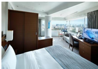
小田急線や新宿駅発着のJR各線が真下に見えるパノラミックキングルームをご用意

【お客様からのお問い合わせ先】 03-5354-2172 (ホテル予約直通、電話受付時間 9:00~17:30)