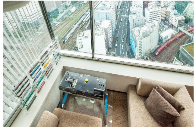
トレインビューを眼下に臨みながら、 模擬運転をお楽しみいただけます

「まるごと小田急プレミアムトレインルーム」は、2021年4月の販売開始以降、多くのお客さまにご利用いただき、“子供がとても喜んだ”、“また運転しにきたい”などの嬉しい声をいただき、夏休みの期間限定で1室増設し、計2室でご提供します。