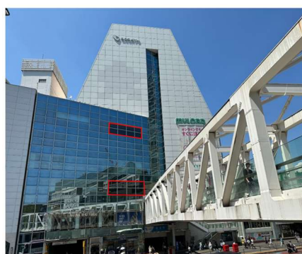
<サインージ設置場所 (赤枠) >

■広告出稿依頼・お問い合わせ 有限会社 浪速 06-6673-8622 info.ad@naniwa-co.com