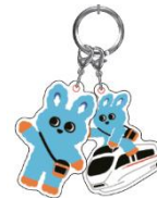
プレゼントイメージ